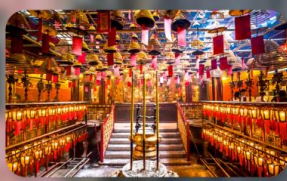
วัดม่านโม